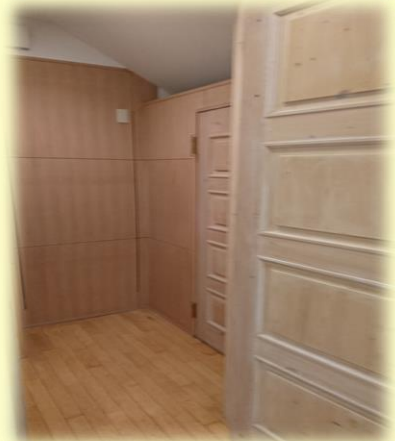
ゆったり広々とした明るいダイニング（多目的室・作業室） クールダウンできる個室もあります。