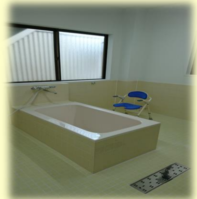
安心の静養室スペース 車イスでもゆったり入れるトイレ 車イスでもゆったり入れるお風呂